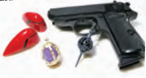
無料貸出小道具の一例